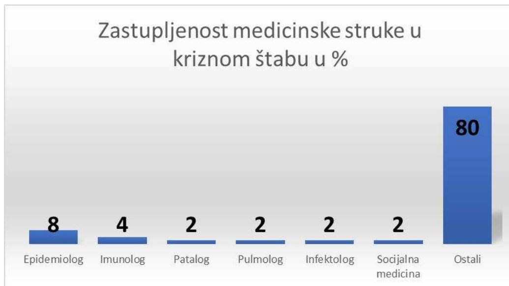
Grafikon 1: Zastupljenost medicinske struke u kriznom štabu u %

Grafički predstavljeno to izgleda ovako: