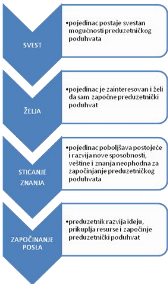
Slika 3: postupak koji pojedinac prolazi od svesti o značaju do započinjanja preduzetničkog poduhvata [autor]

poteze koji su načinili drugi, a još važnije je kako se podnosi neuspjeh. Iz tih razloga je preduzetničko obrazovanje izuzetno značajno. Ljudi koji znaju da ostanu realni i da čvrsto stoje na zemlji u periodima izuzetnih poslovnih uspeha, kao i oni koji znaju da iz doživljenog poslovnog brodoloma izvuku što više pouka, predstavljaju primere pojedinaca svesnih okruženja u kome žive, onih koji imaju viziju budućnosti koja ih stalno gura napred – ka uspehu.