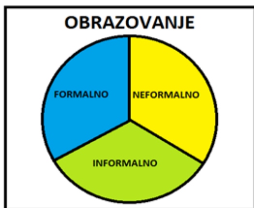
Slika 1 – Vrste obrazovanja: formalno, neformalno, informalno [autor]

„Uspešan preduzetnik poseduje veliku energiju za rad i stabilnost, kreativnost i inovativnost, vizionarske sposobnosti i visok stepen inteligencije, ali ne samo one koja se ostvaruje kroz formalno obrazovanje, već i kroz poznavanje „zakona ulice“ i posedovanje „osećaja za biznis“. [5]