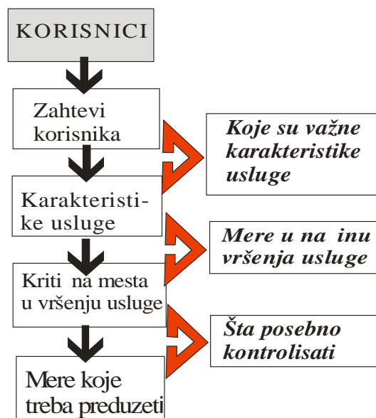
Slika 1: Primena QFD metode na usluzi

Na ovaj na in postiže se nivo kvaliteta koji odgovara zahtevima korisnika. Iz ovoga sledi da primena QFD metode na usluge dovodi do zadovoljstva korisnika i ostvarenja njihove prednosti na tržištu nad konkurencijom, pre svega kvalitetom usluge koja se nudi.