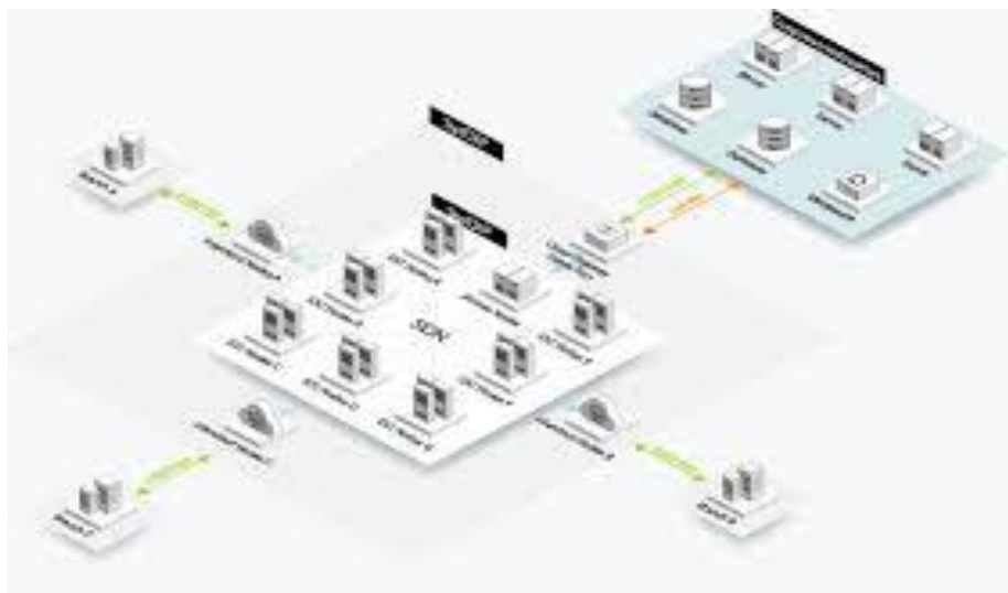
Slika 1. Umrežavanje preduzeća