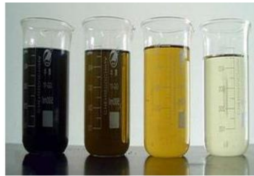
Slika 3. Procedna voda i filtrat

Filtrat (otpadna voda sa deponija) se sakuplja i prečišćava da bi se uklonile štetne materije ili se svele na nivo prihvatljiv za životnu sredinu.