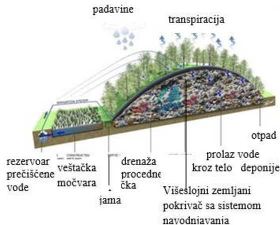
Slika 2. Kretanje vode na deponiji

sakupljaju zagađujuće materije iz njega. Deo tih voda otiče sa deponija, deo se vraća u atmosferu isparavanjem sa gornje površine deponija ili vegetacije (transpiracija), a ostatak se zadržava u gornjem sloju deponija, pri čemu dolazi do povećanja vlage u otpadu. (Slika2)