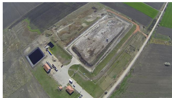
Slika 4. Površina zemljišta namenjena za regionalnu deponiju „Kikinda“

Iako je regionalna deponija „ASA“ u Kikindi, projektovana da opslužuje region od 250.000 stanovnika (sporazum o pristupanju su potpisale okolne opštine Novi Kneževac, Čoka, Senta, Bečej, Žitište, Nova Crnja i Kikinda), trenutno se na deponuju godišnje odlaže 22.000-24.000 t/god otpada sa teritorije opštine Kikinda.