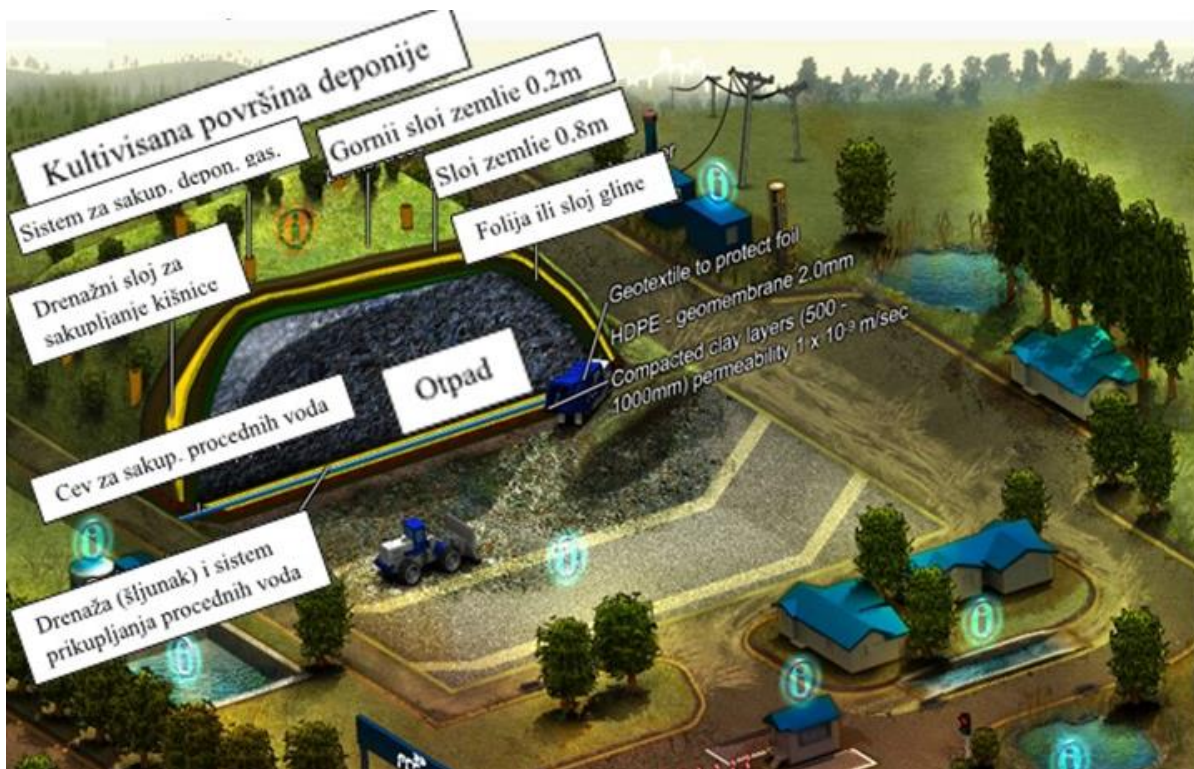
Slika 5. Poprečni presek slojeva regionalne deponije „ASA“Kikinda

deponiju, a samim tim i količine stvorenih procednih voda. Postupak pokrivanja deponije je sličan izgradnji dna deponije. Kada je ćelija deponije popunjena i nema više kapaciteta da se puni otpadom, otpad se teškim mašinama (kompaktorima), sabija i prekriva prekrivačem od polietilenske plastike, sabijenog sloja zemlje i sloja površinske zemlje (humusa) na kojoj može da se zasadi vegetacija i na taj način spreči erozija zemljišta. Progresivnim nabijanjem materijala u deponiji količina ocedne vode se smanjuje za 10-20%.