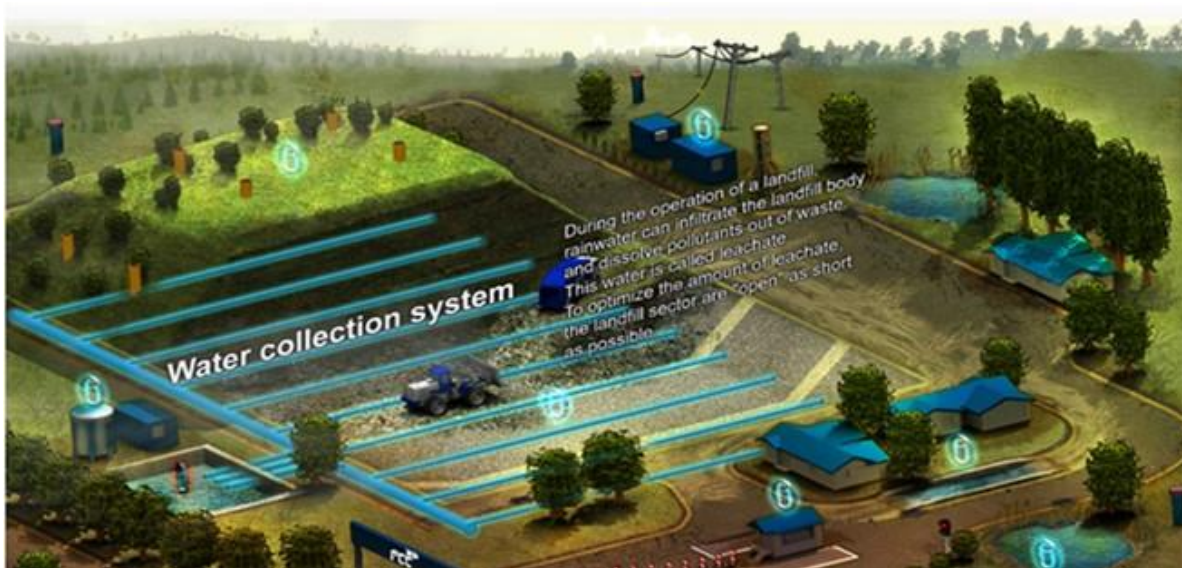
Slika 7. Sistem za upravljanje procednim vodama na deponiji "Kikinda"

Procedna voda koja se uliva u bazen za aeraciju je uglavnom oslobođena krupnih čestica mulja, čime je omogućen ulazak procedne vode u perforirane cevi. Perforacije na cevima su veličine 0,1 mm.